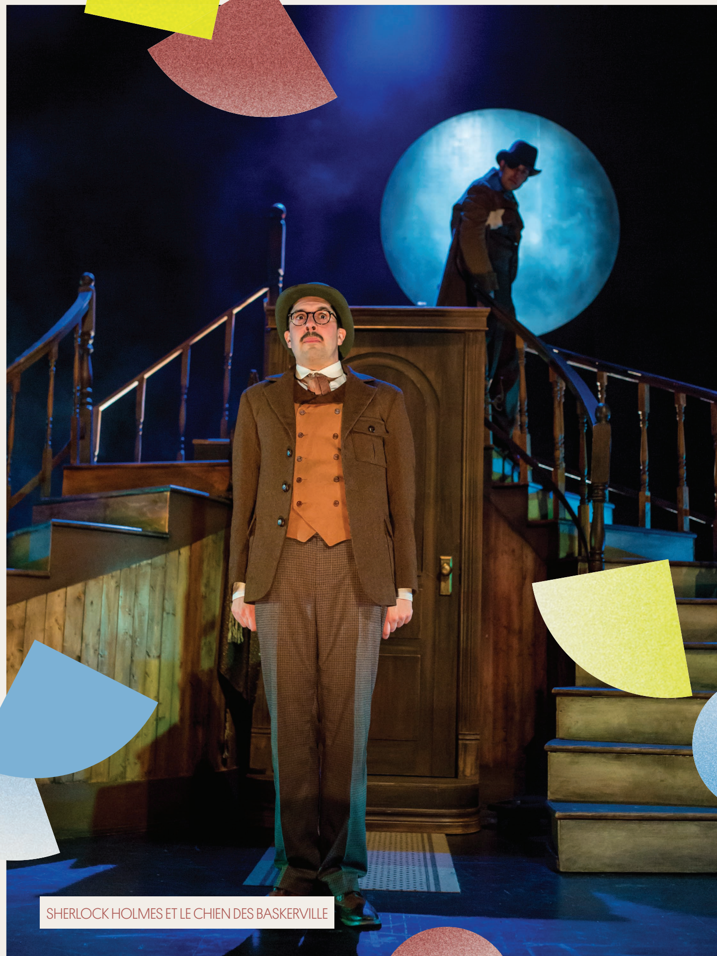
SHERLOCK HOLMES ET LE CHIEN DES BASKERVILLE

Le Théâtre Desjardins est heureux d'offrir une programmation dédiée au public scolaire dès l'âge de 3 ans. Les enfants pourront découvrir différentes disciplines telles que le cirque, le théâtre, la danse et bien plus.